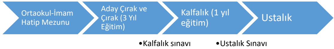
Şekil 4 Ustalık Süreci

Ayrıca, ustalık belgesi sahipleri talep etmeleri durumunda iş pedagojisi kursunu tamamlaması ve sınavda başarılı olmaları neticesinde usta öğreticilik unvanına da sahip olmakta ve işyerlerinde çırakların yetiştirilmelerine imkân sağlamaktadırlar. Yukarıda ayrıntıları anlatılan söz konusu süreçlerin özetlenmiş haline aşağıdaki şekilde yer verilmiştir.